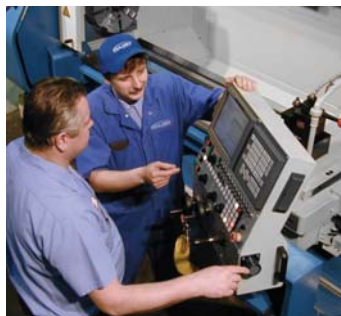
Servicio Confiable y Soporte