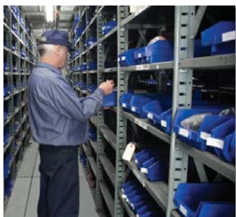
Miles de Partes y Opciones